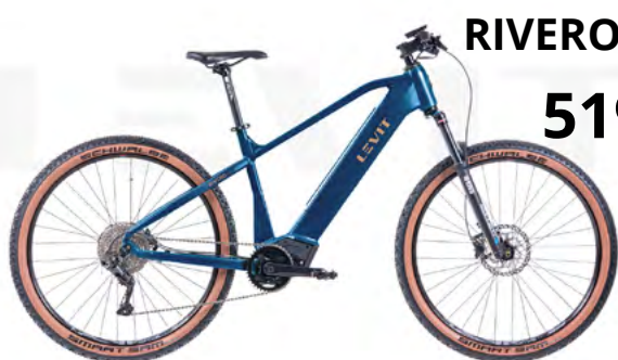
RIVERO MTB HORSKÉ