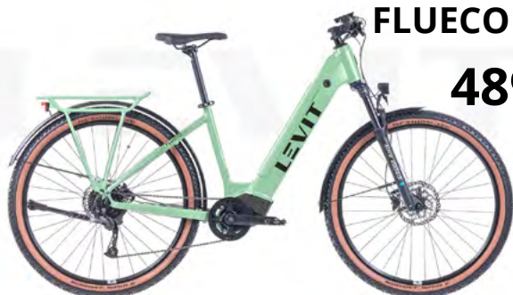
FLUECO eSUV MĚSTSKÉ